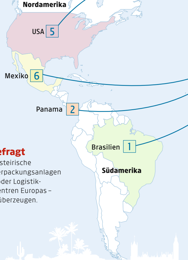
KLEINE ZEITUNG

Ob Grazer Messtechnologie für die indische Bahn, steirische Medizintechnik für eine Reha-Klinik in Panama, Verpackungsanlagen aus Gleisdorf für ein Petrochemiewerk in Nigeria oder Logistik-Know-how aus Hart für eines der größten Verteilzentren Europas – wo und wie Steirer mit ihren Innovationen global überzeugen.