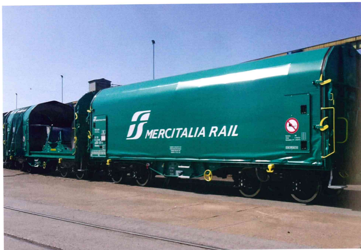
Mercitalia Rail rüstet die Transportflotte mit 240 multifunktionalen Load Monitoring-Systemen von PJM auf.